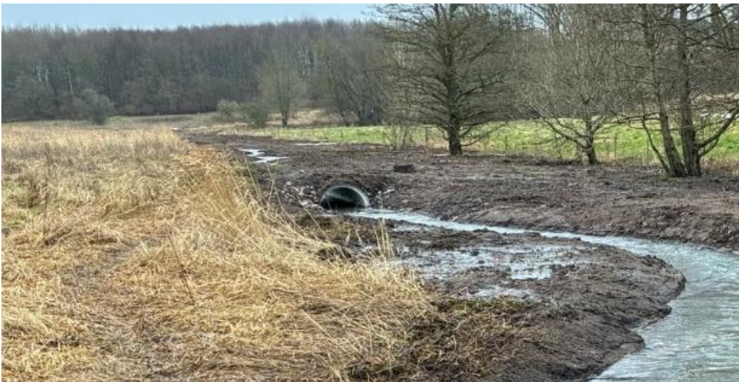
Figur 3: Eksempel på rørbro i terrænnært vandløb.

For at sikre den fremtidige adgang til arealerne samt understøtte muligheden for afgræsning af disse etableres en Ø100 cm rørbro i det nye forløb. Røret graves omtrent 30 cm ned i vandløbsbunden.