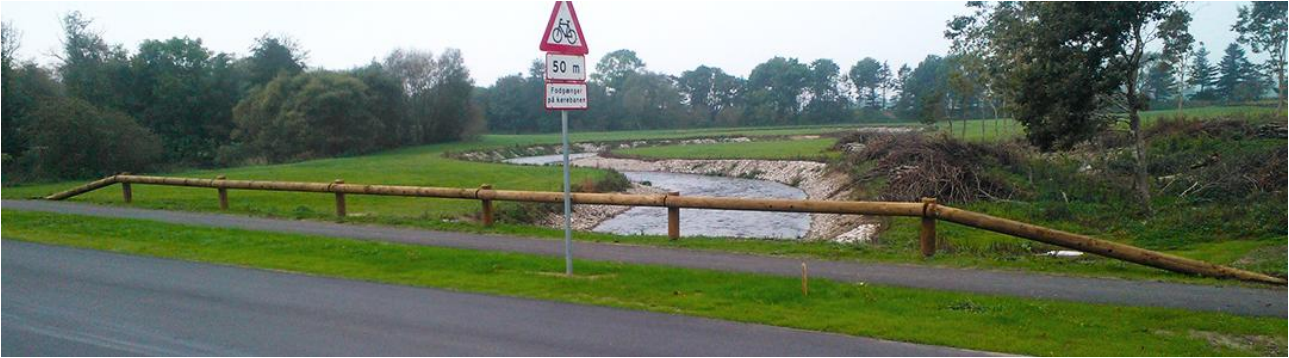
Figur 2: Modelbillede af typen af træautoværn.