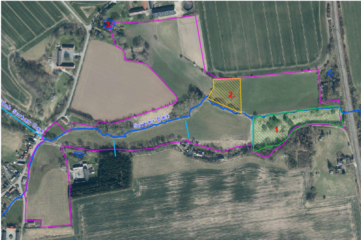
Figur 2: Udpegning af de § 3-beskyttede arealer i tilknytning til projektområdet

Oversigtskort over projektområdet med naturområder, som er beskyttet jf. naturbeskyttelseslovens § 3 fremgår af nedenstående Figur.