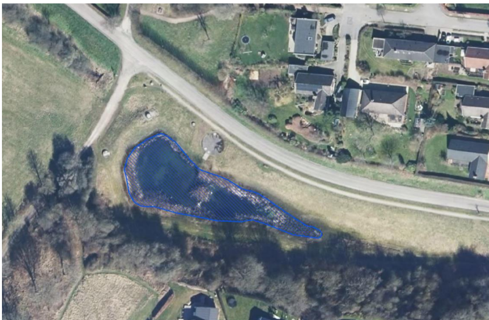
Figur 2: Oversigtsbillede over regnvandsbassinet i ortho foto.