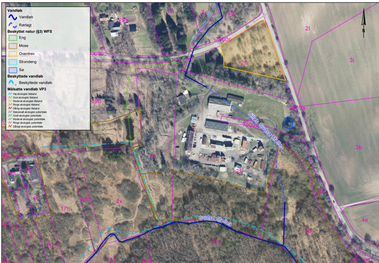
Figur 1. Oversigtskort der viser Tilløb til Gudsø Mølleå nuværende forløb samt beskyttede og målsatte vandløb.

Den pågældende strækning af Tilløb til Gudsø Mølleå er ikke beskyttet efter naturbeskyttelseslovens § 3. Tilløb til Gudsø Mølleå er omfattet af miljømålet 'god økologisk tilstand' i Vandområdeplan for Lillebælt/Jylland 2021-2027.