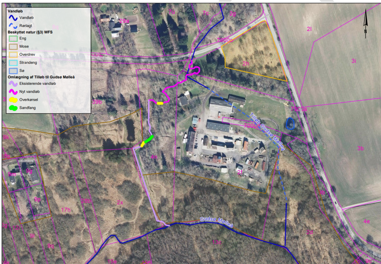
Figur 2. Oversigtskort der viser den projekterede omlægning af Tilløb til Gudsø Mølleå samt vandløbets nuværende forløb.

Det eksisterende vandløb, som Tilløb til Gudsø Mølleå tilsluttes, har et gennemsnitligt fald på 10 ‰ fra kote 5,50 m til 3,40 m.