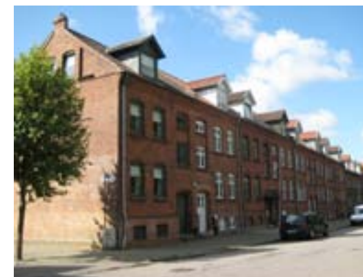
Eks: De meget ensartede rækkehuse i Nørre Voldgade blev i sin tid opført af Arbejdernes Byggeforsening som boliger til de mange arbejdere fra byens fabrikker. Forhuse og baghuse er et samlet projekt, og helheden er særdeles velbevaret. Baghusene er derfor klassificeret som bevaringsværdige.