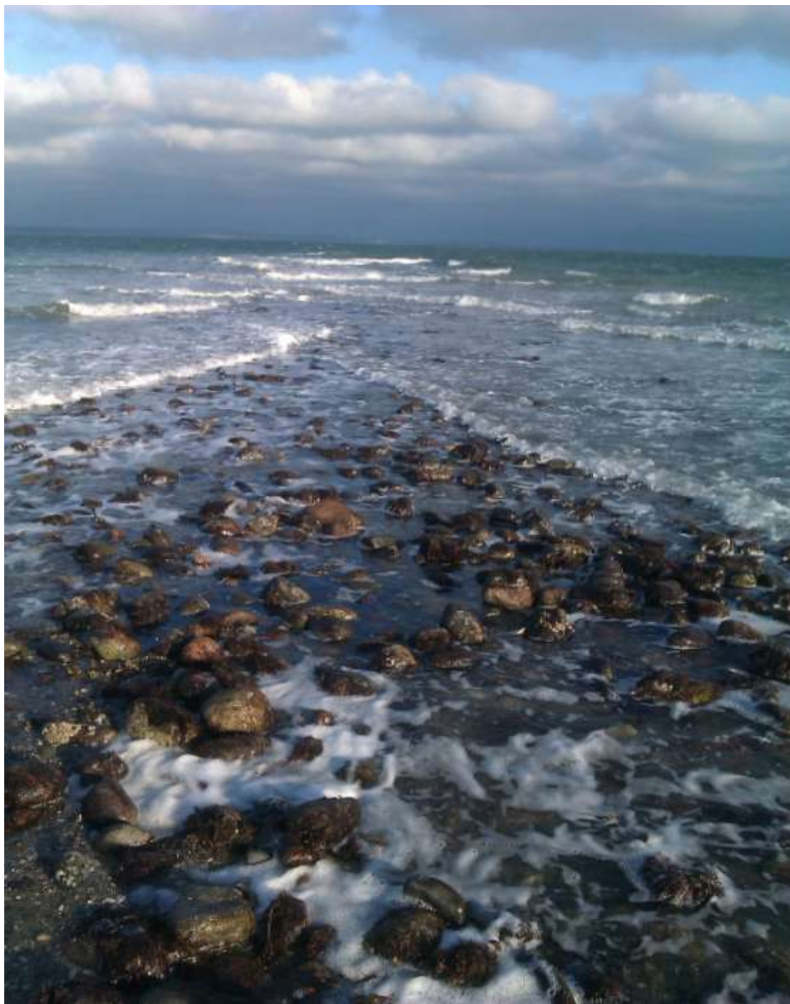
Vandende mødes under stormvejr og lavvande ved Trelde næs