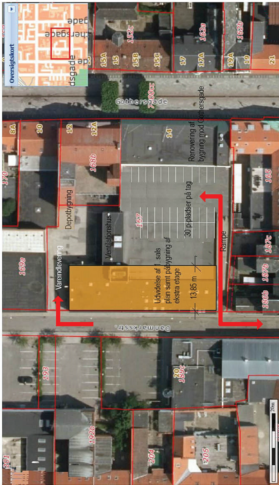
GOTHERSGADE 14 - Situationsplan