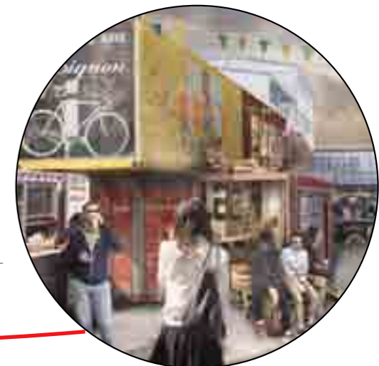
Gl. Havn - liv med midlertidige containerbutikker