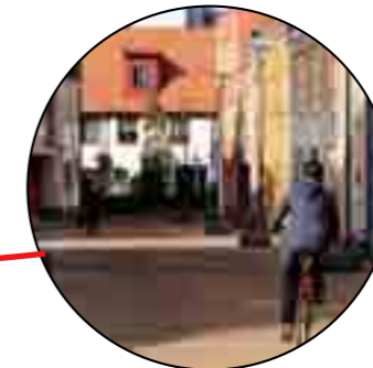
Danmarksstræde - ny passage