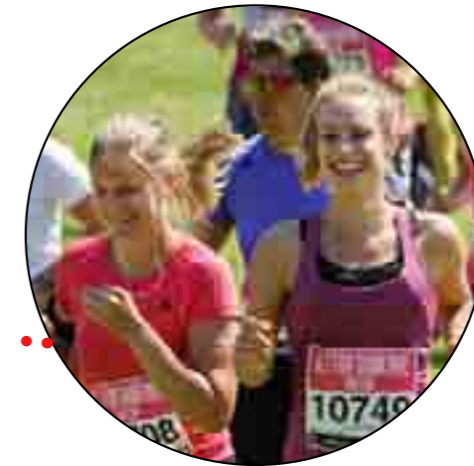
Fritid og kultur binder bymidten og FredericiaC sammen