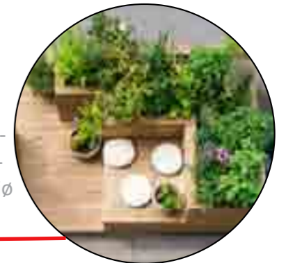
Axeltorv - grønt opholdsmiljø