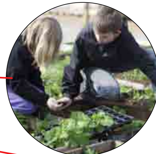
J. B. Niensens Plads - byhaver - sammenbinding til FredericiaC