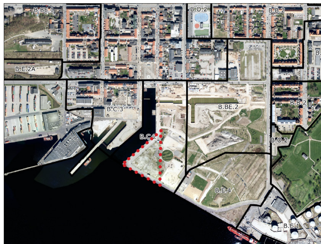
Figur 1 - Eksisterende forhold

Ved at ophæve lokalplan 22A uden vedtagelse af en ny lokalplan åbnes der allerede nu mulighed for lokalplanlægning og udvikling af naboområder, som ellers ville være begrænsede af de høje miljøklasser, som lokalplan 22A giver mulighed for. Der vil også være mulighed for at planlægge for at lokalplan 22A's område anvendes til centerformål.