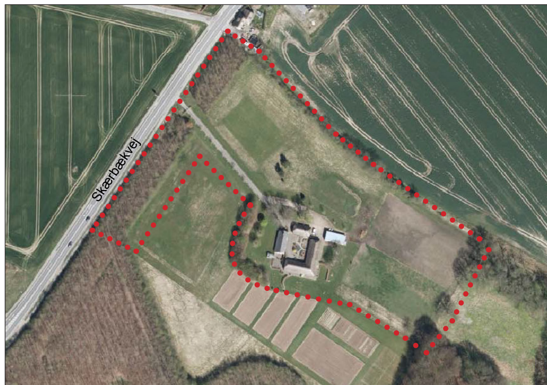
Figur 1 - Eksisterende forhold

Arealet som omfattes af lokalplan 276 er ikke forsøgt udstykket og bebygget i overensstemmelse med de muligheder som lokalplanen rummer. Området har ligget ubebygget hen siden 2007.