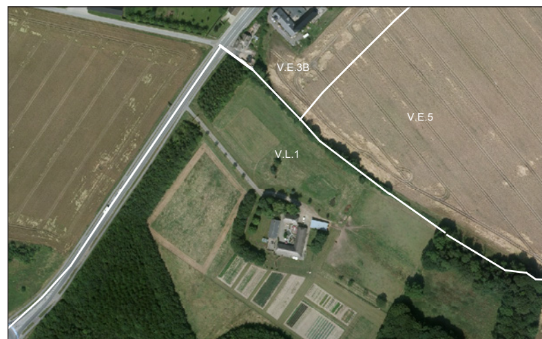
Figur 3 - Rammer i Kommuneplan 2017 - 2029