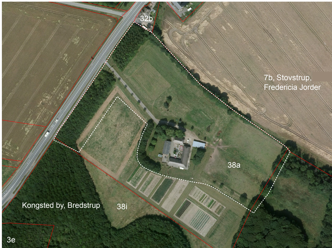
Ejerlav: Kongsted by, Bredstrup og Stovstrup, Fredericia Jorder