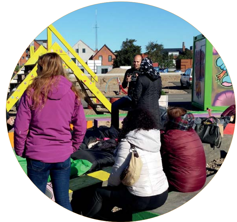
Containerbyen på FredericiaC - etableret i fællesskab med borgere

Det er som sagt to helt forskellige former for borgerinddragelse. Men det er vores opgave at finde ud af, hvordan de kan spille sammen.