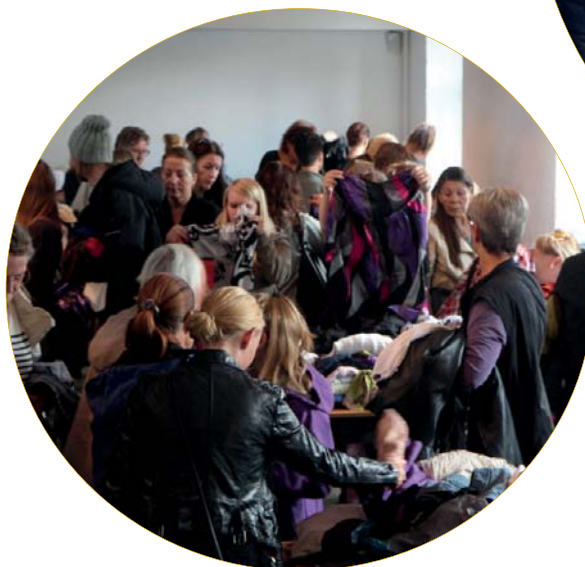
Tøjbyttedag - kommunens Grøn sekretariat har arrangeret tøjbytte marked