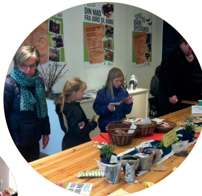
Frøbyttedag - kommunens Grøn sekretariat har arrangeret en dag hvor alle kan komme og bytte deres hjemmedyrkede frø