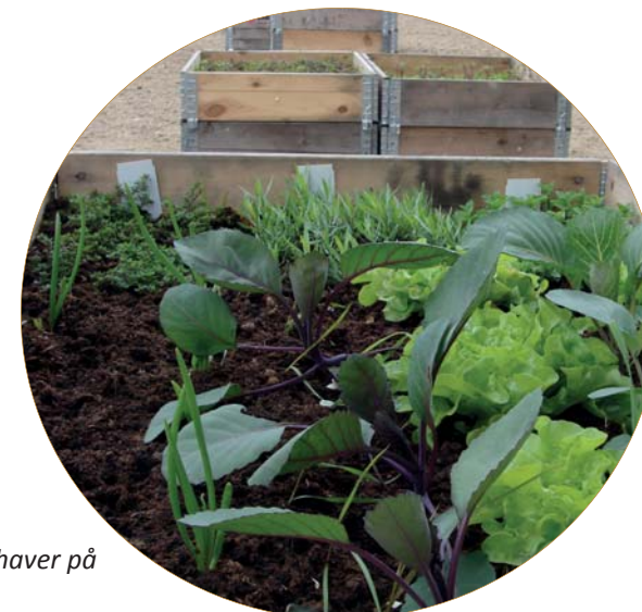
Grow Your City - borgerdrevne byhaver på FredericiaC