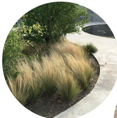
Beton og beplantning vil kræve et minimum af vedligehold

Ny og bedre belysning etableres langs den grønne rekreative sti.