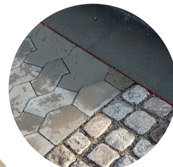
Der bruges materialer der allerede findes i Kanalbyen ved Lillebælt