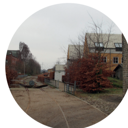
Fra Tøjhuset langs sti og jernbane