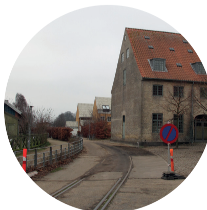
Fra J. B. Nielsens Plads

Den planlagte rekreative grønne forbindelse mellem havn og vold, er endnu ikke påbegyndt.