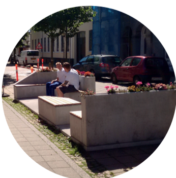
Byrumsinventar fra Gothersgade kan videreføres.