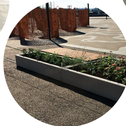
Plantekasser magen til dem på J. B. Nielsens plads kan opstilles langs og på jernbanesporet.