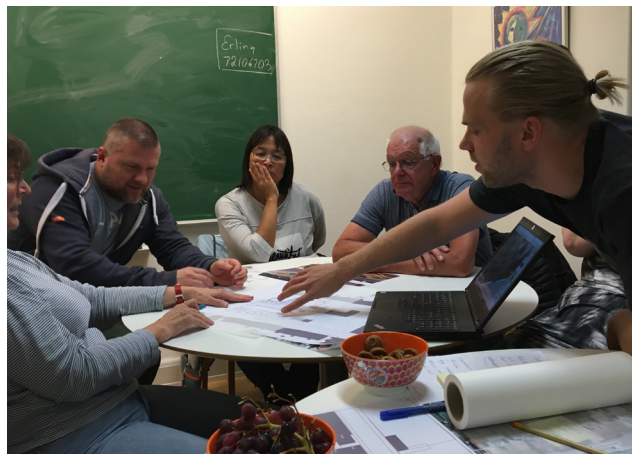
De lokale aktørgrupper støtter op om veteranprojektet