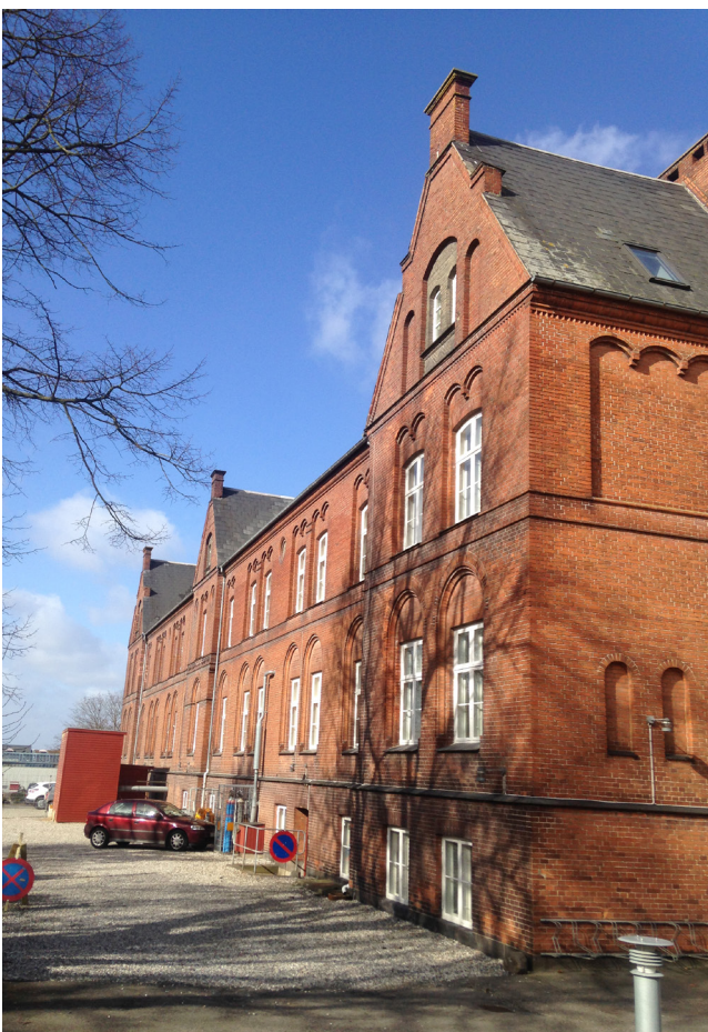
Depotgården set fra syd-øst

Depotgården er kommunens og byens aktivitetshus. Depotgården har potentiale til mere, og kan med fordel omfavne flere og gerne yngre personer, som kan medvirke til at udvikle husets potentiale. På den baggrund er veteranerne velkomne aktører.