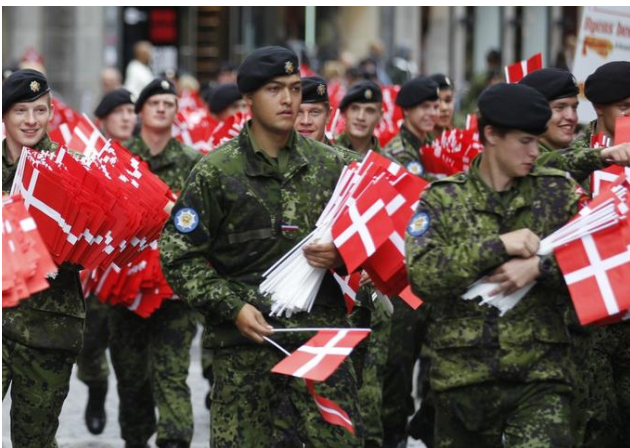
Veteraner i gadebilledet

Den tredje gruppe - 3 - de raske eller veteranerne uden behandlingsbehov – vender tilbage til en almindelig hverdag med job og partner/familie og venner. Vender hjem til faste rammer og en stabil situation. De kan til tider have brug for "et helle eller et frirum" sammen med andre veteraner eller bare have lyst til f.eks. at gå til sløjde, lave mad eller i det hele taget bare deltage i nogle aktiviteter sammen med andre veteraner.