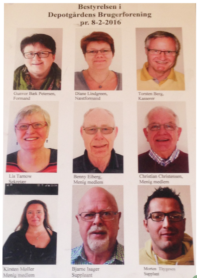
Bestyrelsesmedlemmer i Depotgårdens Brugerforening

Depotgården betegner sig selv som en eksplosiv oase midt i Fredericia, hvor alle kan udtrykke sig kreativt.