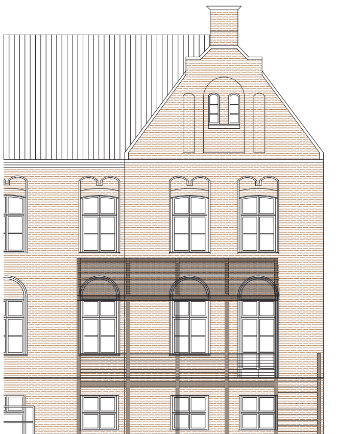
Glasoverdækket terrasse - sådan kunne den nye terrasse se ud Illustration Arkitekt C.

Når byggerierne er færdige, afsluttes arbejderne med forskønnelse af udearealerne.