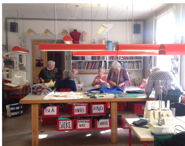
Fotos fra nogle af Depotgårdens mange værksteder

Projektet omhandler bl.a. at få veteranerne og deres pårørende til at komme i huset og bruge alle husets muligheder for på den måde at integreres både i husets kreative miljø, de øvrige brugere og i lokalsamfundet.