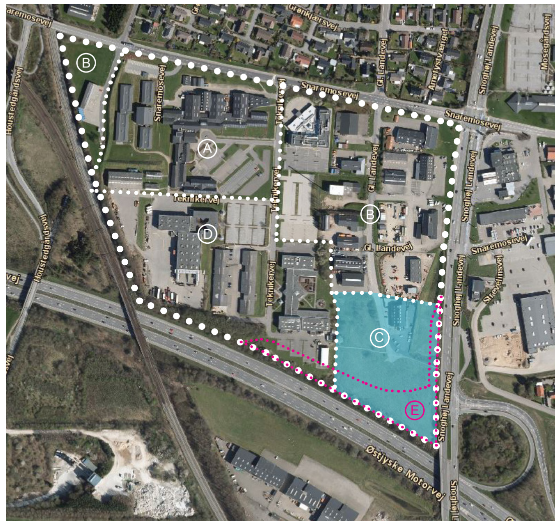
Figur 1 - Lokalplan 303 med markering af delområderne.