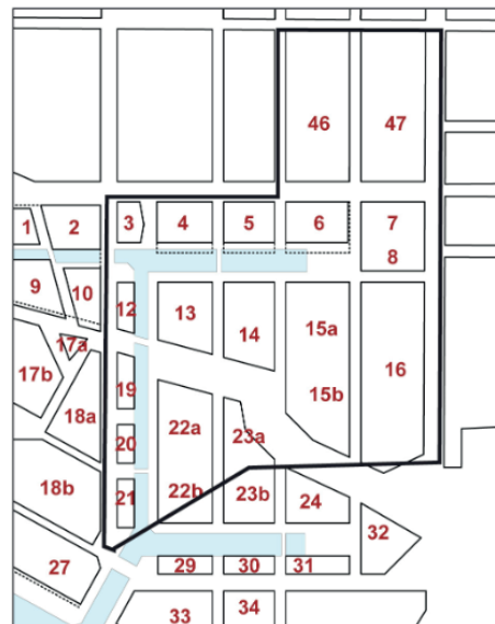
Karrénumre som vist i udviklingsplanen for Kanalbyen i 2012.