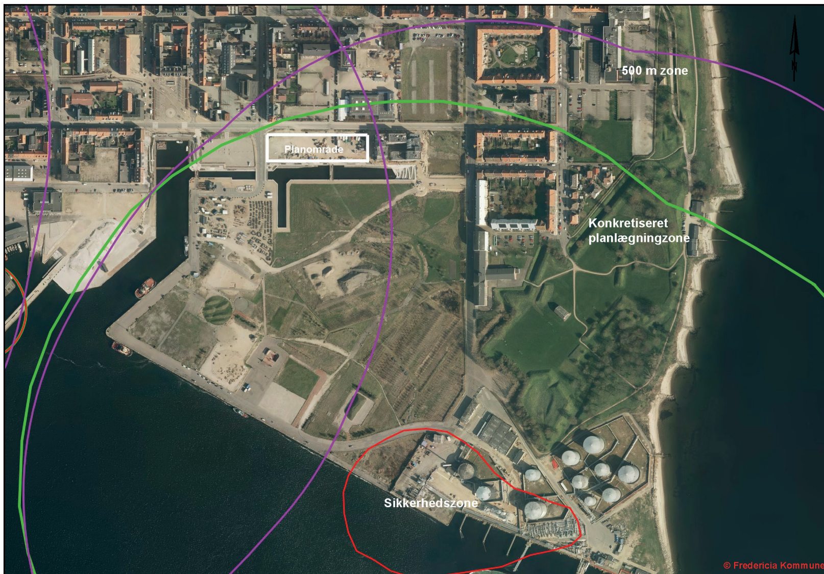
Planlægningszone 500 meter (lilla) og sikkerhedszone (rød) i forhold til Shell Havneterminal. Konkretiseret planlægningszone er vist med grøn. Planlægningszonen omfatter hele lokalplanens område. Retningslinje F6.4.1.