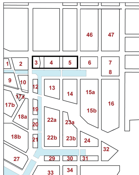
Figur 1. Karrénumre som vist i udviklingsplanen for Kanalbyen i 2012.