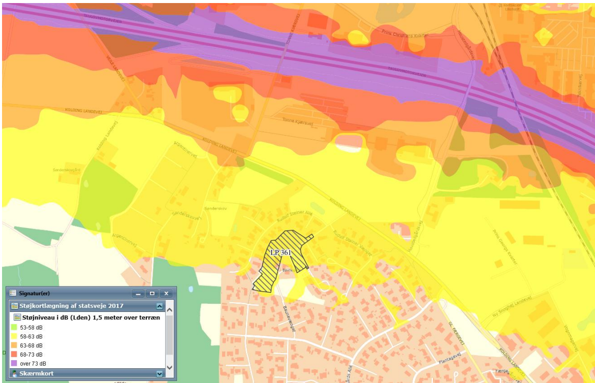
Udsnit af Vejdirektoratets støjkortlægning 2017

Vejdirektoratets støjkortlægning fra 2017 viser, at støjpåvirkningen af hele lokalplanområdet, er mere end 58 dB (L den ).