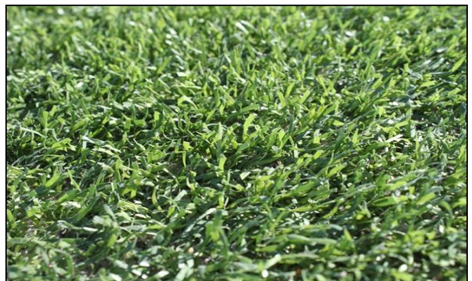
Monofilament Xpert33 installeret maj 2010