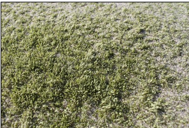
Splitfiber installeret af en konkurrent i august 2011