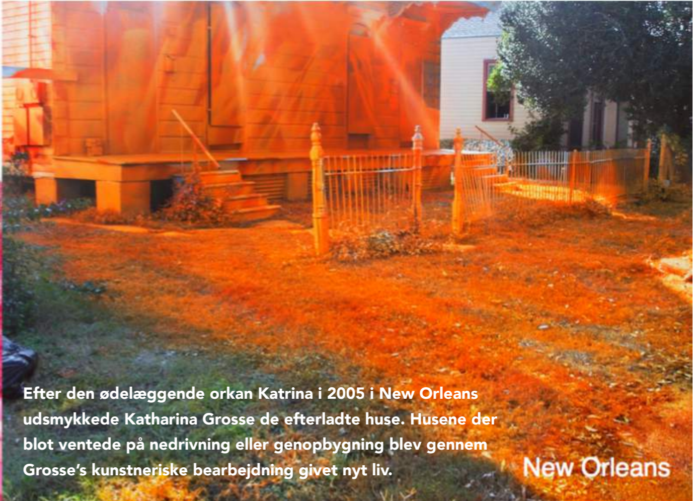
Efter den ødelæggende orkan Katrina i 2005 i New Orleans udsmykkede Katharina Grosse de efterladte huse. Husene der blot ventede på nedrivning eller genopbygning blev gennem Grosse's kunstneriske bearbejdning givet nyt liv.