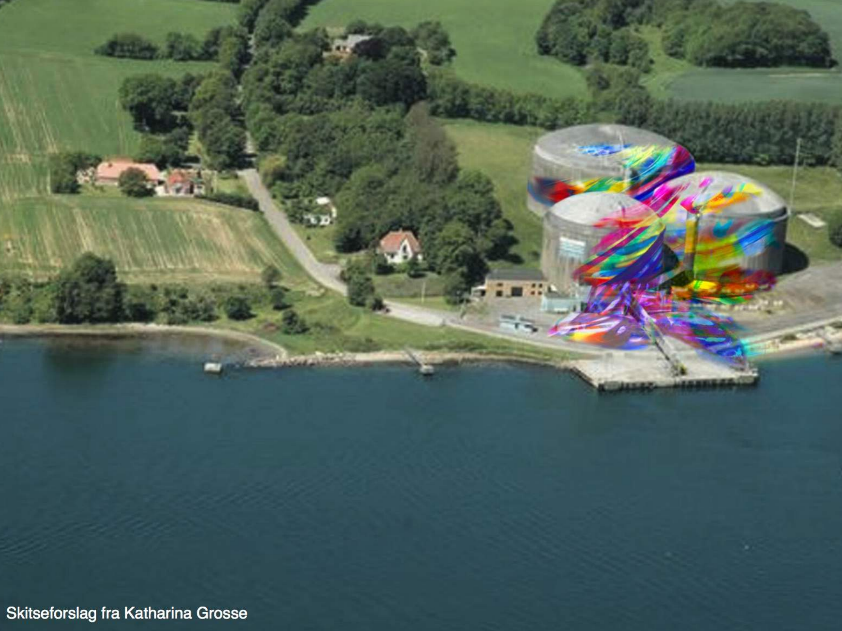
Skitseforslag fra Katharina Grosse