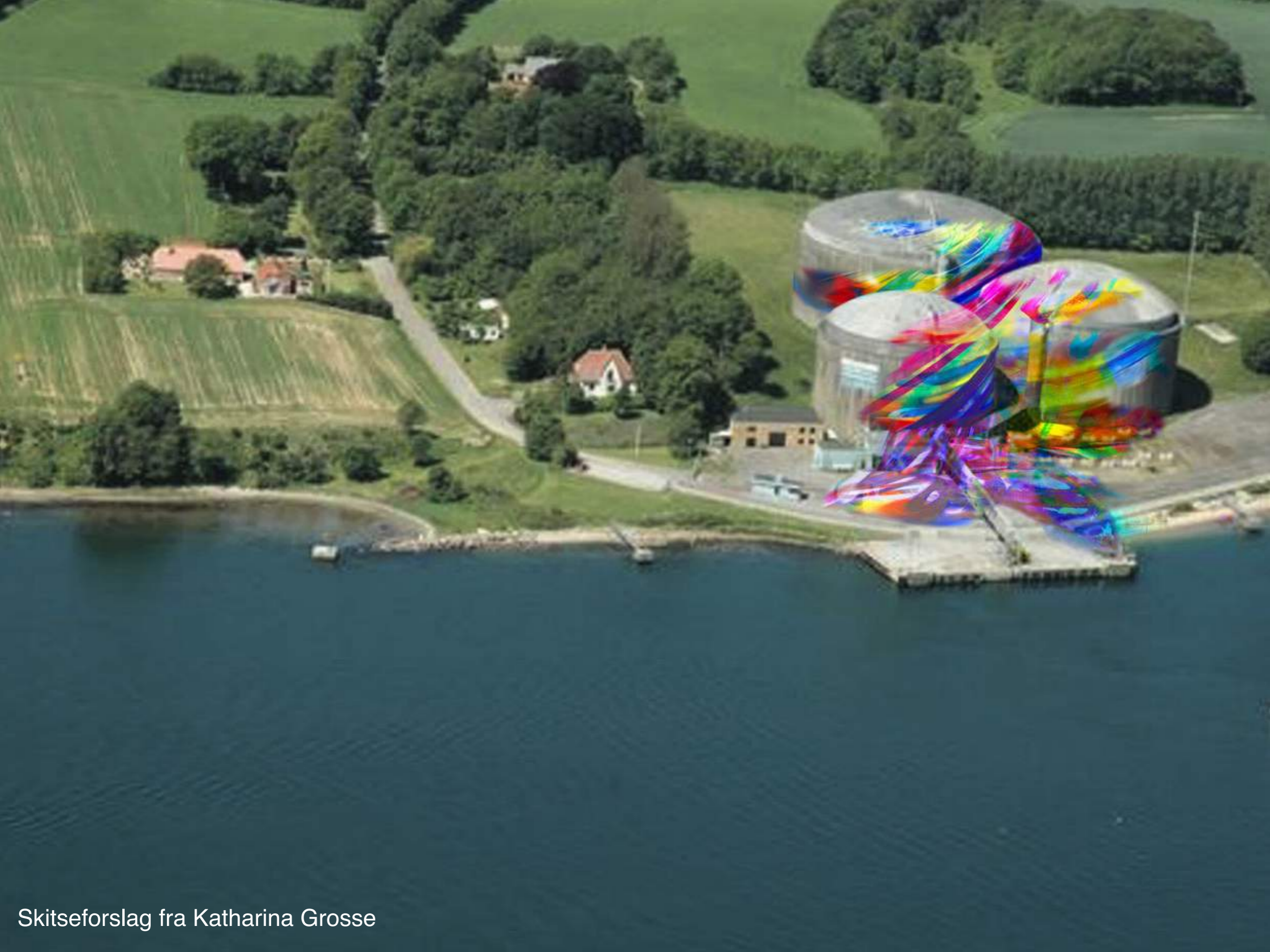
Skitseforslag fra Katharina Grosse