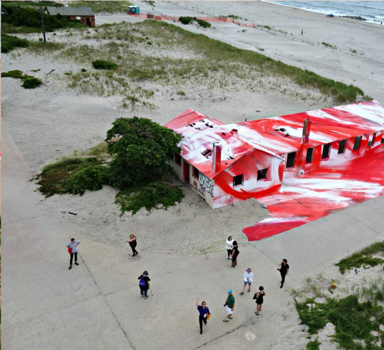
New York's Rockaway Beach