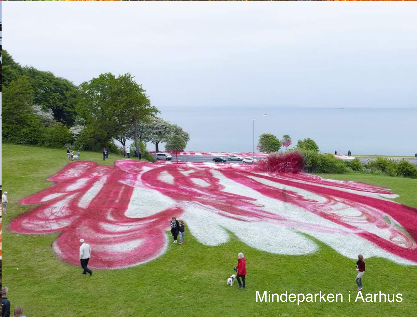
Mindeparken i Aarhus