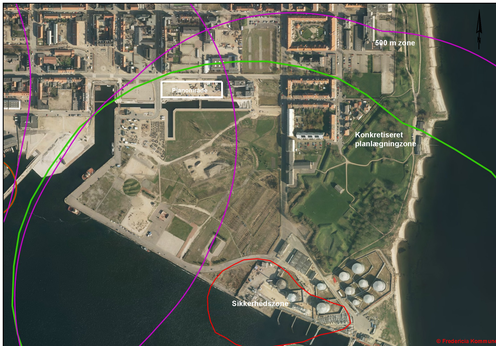
Planlægningszone 500 meter (lilla) og sikkerhedszone (rød) i forhold til Shell Havneterminal. Konkretiseret planlægningszone er vist med grøn. Planlægningszonen omfatter hele lokalplanens område. Retningslinje F6.4.1.