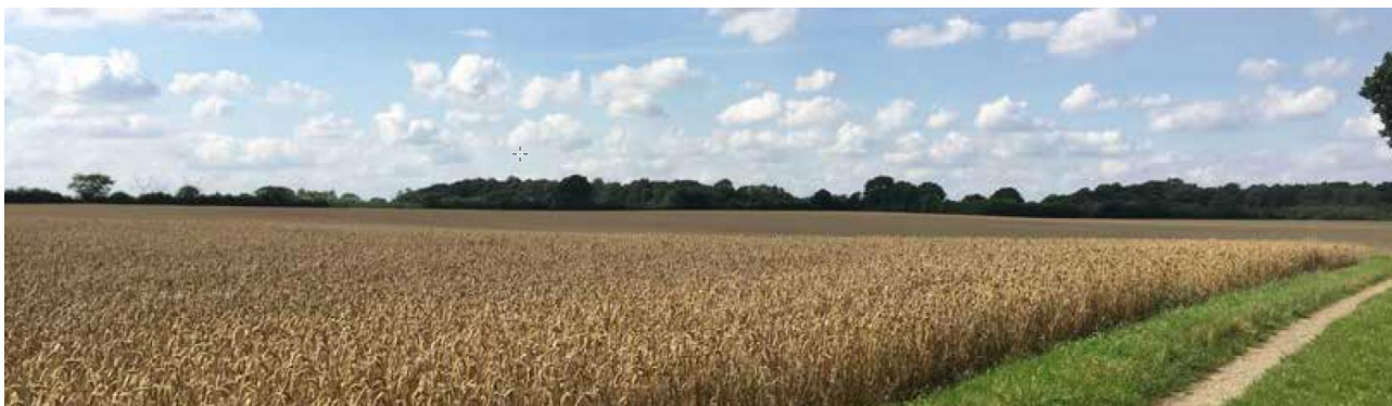
Foto af Sønderskov-området set mod nord fra områdets sydlige kant. Skovbryn og levende hegn afgrænser en åben landbrugsflade, der fremstår som forholdsvis fladt terræn.

Udpegningerne ændrer ikke ved de helt kystnære skråninger ud mod Lillebælt, som er karakteristisk kystklint med stor geologisk og betydelig landskabelig værdi. Desuden vil de kystnære skove, skovbryn og levende hegn fortsat kunne opleves i området.