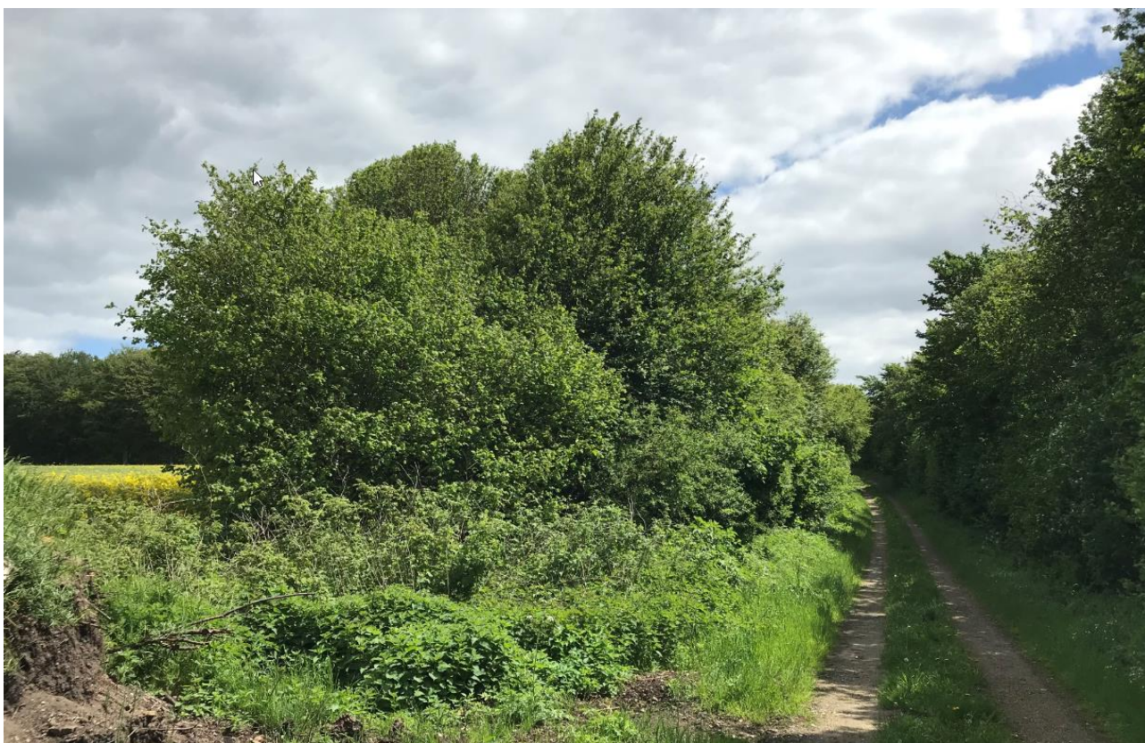
Sønderskov-området er indrammes af levende hegn og tilgrænsende mindre skovarealer.

Der er over 5 km til nærmeste Natura 2000 område Lillebælt, der ikke vil blive påvirket af planlægningen.