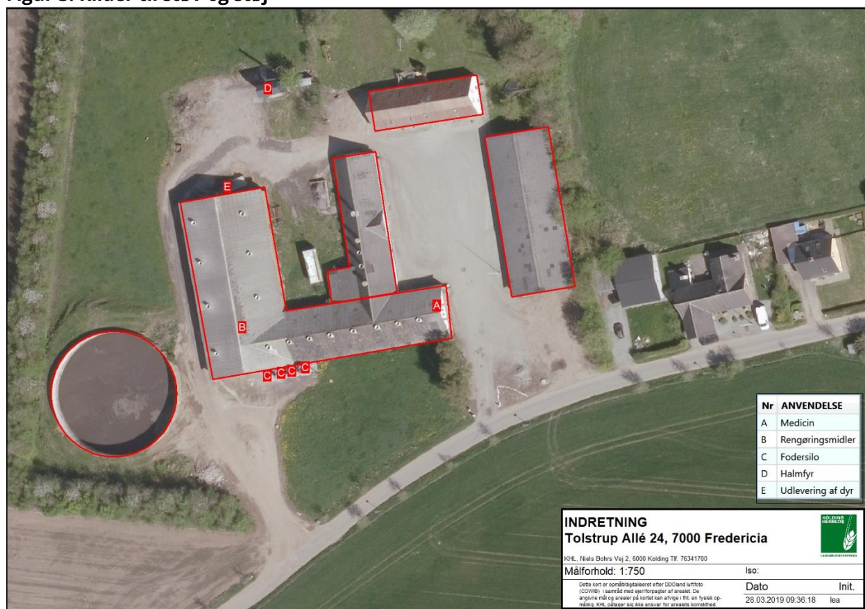
Figur 3. Kilder til støv og støj