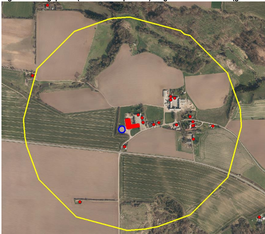
Figur 1. Høringsparter (røde adressepunkter) i lugtkonsekvenszonen (gul cirkel)