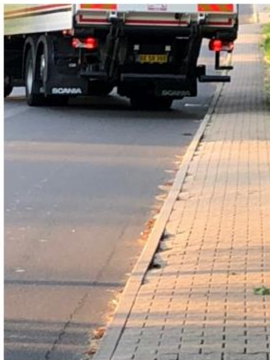
Lastbiler på GLFærgevej