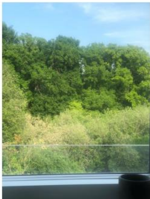
Træerne ved mose/skrænt