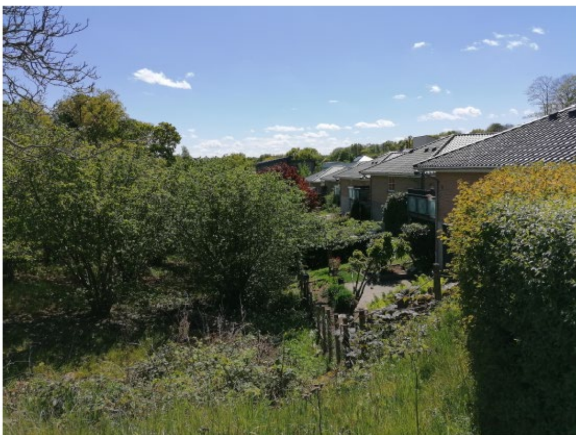
View fra punkt A