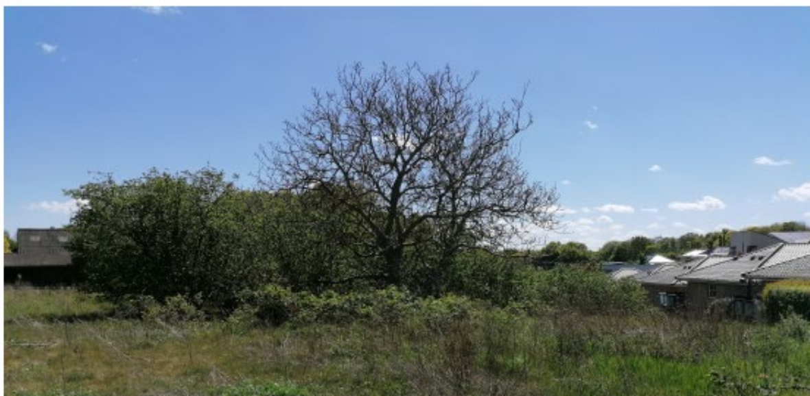
View fra punkt B