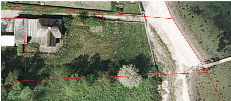
Ejendommen 2008 – haveareal