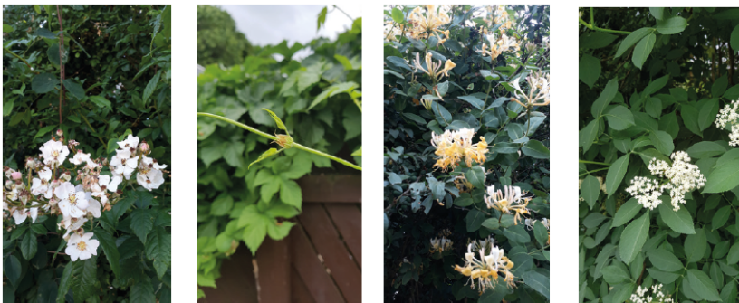
Billeder: Set fra venstre mod højre: Hunderose, humle, kaprifolie og hylde - eksempler på plantevalg i grønningerne.

Endelig kan bluespot områderne gives en karakter af ny natur og regnvandsbassiner kan udformes som en naturligt udseende sø.