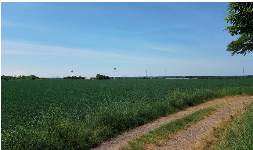
Billede: Lokalplanområdet set fra Højgård og mod nordvest - området rummer ingen landskabelige værdier.

Lokalplanområdet kan beskrives som et bundmorænelandskab med enkelte, karakteristiske afløbsløse lavninger som giver området et let dødispræg. Området udgør et højt liggende plateau, med få karaktergivende elementer. Udsigten fra området mod nord og vest er præget af mødet med det åbne land der på dette sted præges af tekniske anlæg i form af vindmøller, højspændingsledninger og radiomast. Området rummer ingen landskabelige værdier, jf. kommuneplanens retningslinjer for landskaber og geologiske bevaringsværdier.