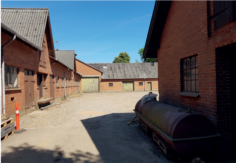
Billede: Højgård der nedrives i forbindelse med planens realisering.

Lokalplanområdet ligger hovedsageligt i landzone, bortset fra et lille område ned mod Vestre Kobbelvej (del af matr. nr. 367c Fredericia Stadsjorder) der ligger i byzone. I forbindelse med den endelige vedtagelse af denne lokalplan overføres det på kortbilag 3 viste område til byzone.