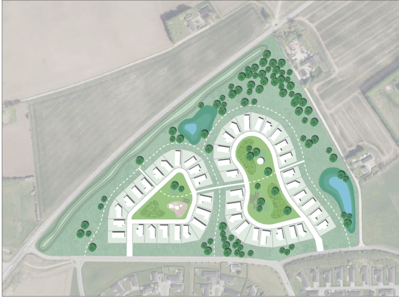
Illustration: Illustrationsplan visende en mulig udnyttelse af området i overensstemmelse med lokalplanens overordnede principper.