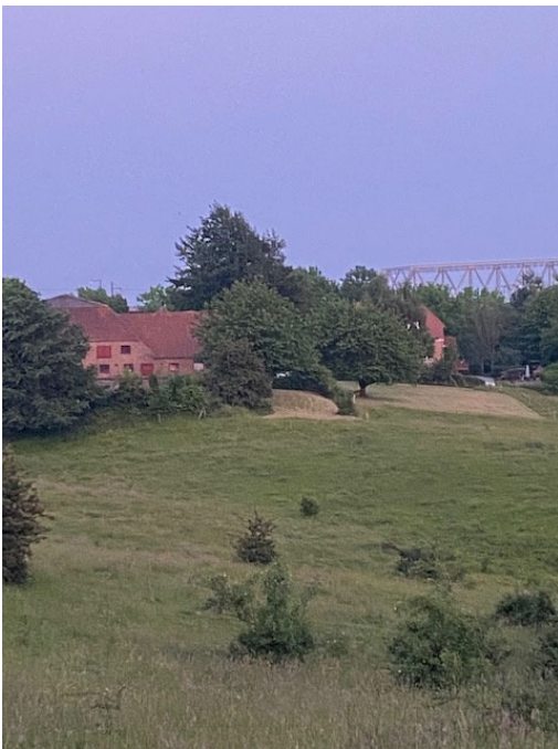
Figur 3. Nuværende bebyggelse

Bebyggelsen på matr.nr. 2 bs Erritsø by vil stride mod såvel nuværende kommuneplan som mod de intentioner, der har været med arealet siden Erritsø kommune forhandlede parken til brug for offentligheden, stadfæstet af Fredericia Kommune ved en deklaration i 1983, som har omhandlet en del af det planlagte areal til bebyggelse.