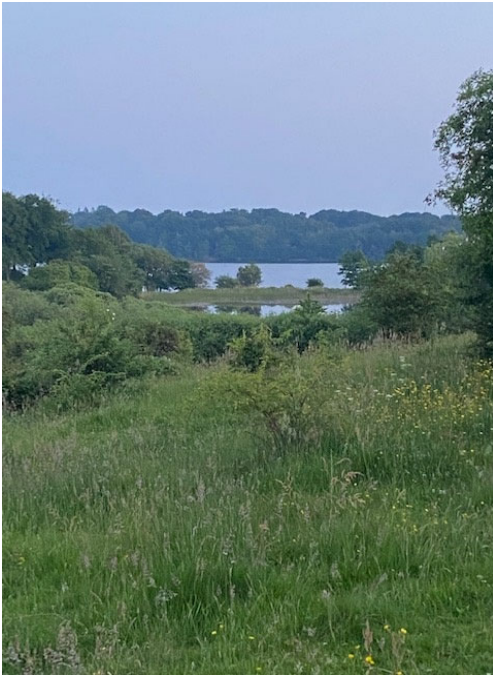
Figur 1. Overdrev, sø, mose