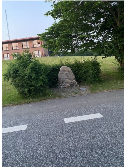
Figur 2. Krigergraven