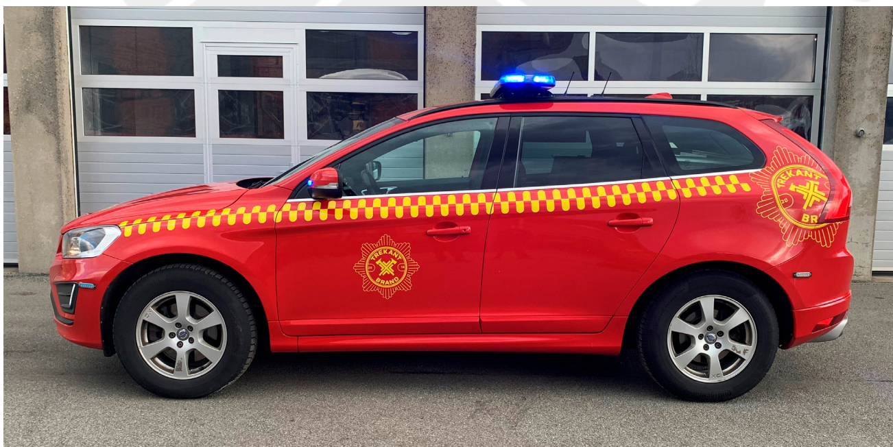
Alle biler bliver kommer også til at have ens stafferinger. Her en af de nye indsatslederbiler