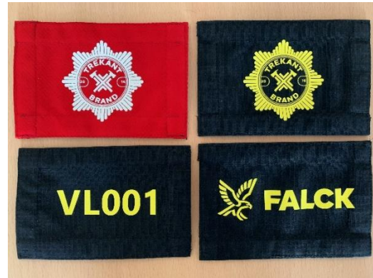
Billede af ærmelogoer med brandmands ID for sikker identifikation.