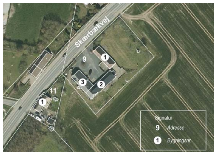
Illustration: Bygningsnumre på Skærbækvej 9 og 11.

Bygningerne på Skærbækvej 9 og Skærbækvej 11 er sidst vurderet i 2009. I forbindelse med planlægningen for anden etape af boligområdet Fuglsang Vest er bygningernes bevaringsværdi vurderet igen. Vurderingen fremgår herunder.