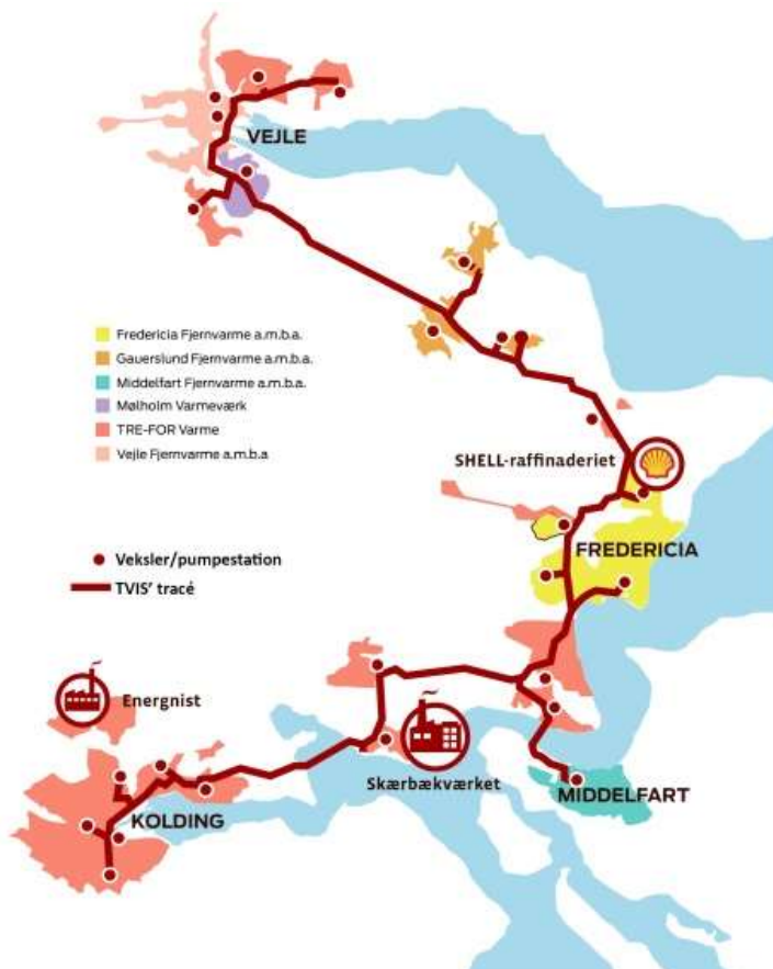
Fig. 2: Transmissionsnettet i Trekantområdet

TVIS driver i dag 83 km transmissionsledning, 29 varmevekslerstationer samt 5 pumpestationer og leverer varme til 183.000 borgere svarende til 83.000 husstande i Trekantområdet.