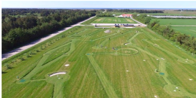
Fodboldgolfbane – enkelte, små- og diskrete forhindrenger

Det fremgår af ansøgningen, at ejendommen er på 188.000 m 2 , der henligger i græseng, som efter det oplyste slås på selve banen, men ikke i randbeplantningen, ligesom der opsættes små diskrete forhindrenger udført i egetræ og mark/kampesten, som vist nedenfor: