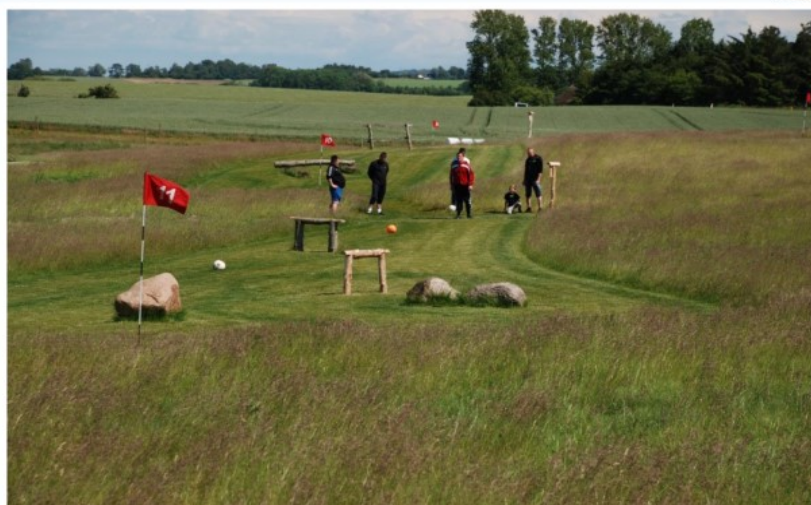
Fodboldgolfbane – enkelte, små- og diskrete forhindringer

Det er desuden oplyst, at det ansøgte ikke vil kræve ny bebyggelse, og banen vil være åben hele året ca. i tidsrummet kl. 9-18.