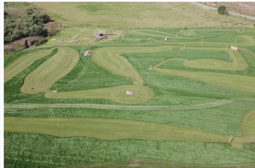
Banen udformes, ved at græsset slås på selve banerne, og "udenomsgræsset" forbliver vildt/naturligt