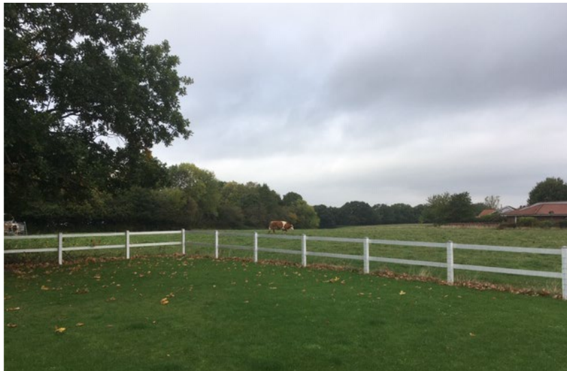
Udsyn fra vores terrasse