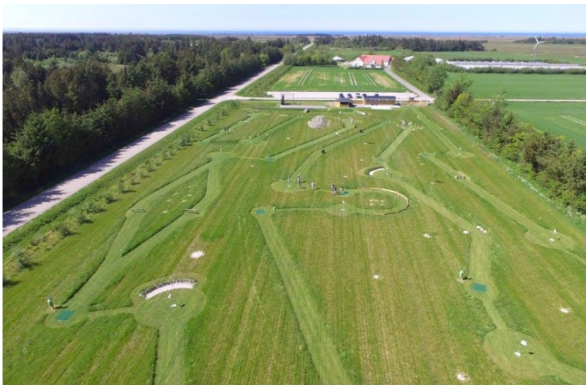
Fodboldgolfbane – enkelte, små- og diskrete forhindringer