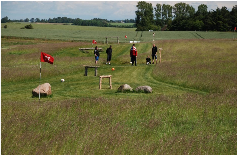
Fodboldgolfbane – enkelte, små- og diskrete forhindringer