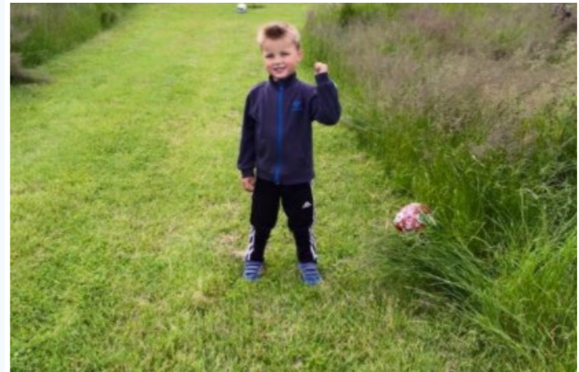
Banen udformes, ved at græsset slås på selve banerne, og "udenomsgræsset" forbliver vildt/naturligt