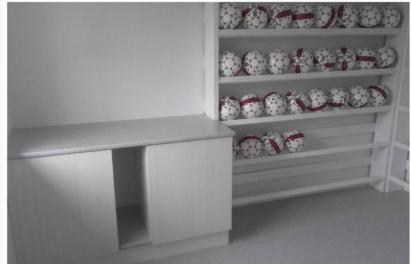
Bold-opbevaring i eksisterende lade