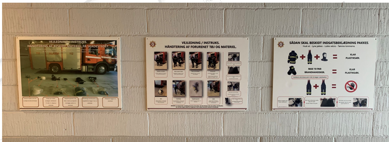
Plancher på stationerne viser hvordan indsatsdragter og materiel skal pakkes ned.

Arbejdet med TRIM er blevet mere systematiseret, sådan at en række oplevelser helt automatisk igangsætter beredskabet.