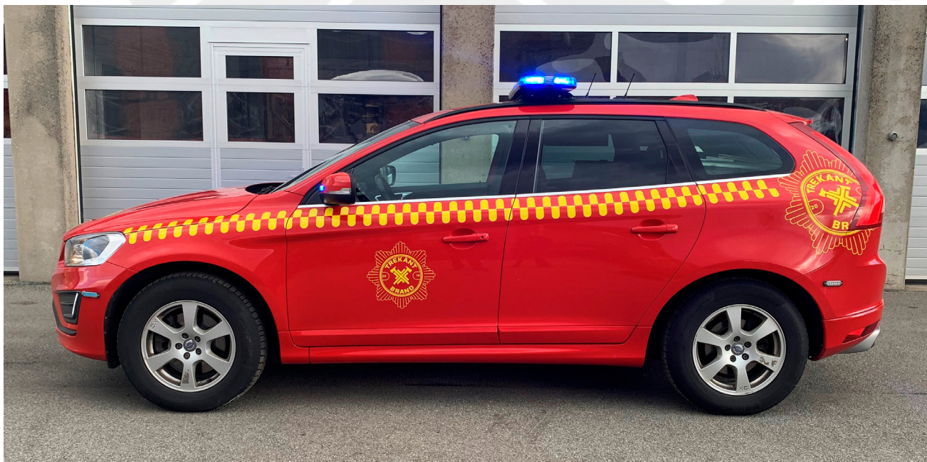
Alle biler bliver kommer også til at have ens stafferinger. Her en af de nye indsatslederbiler