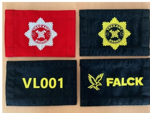
Billede af ærmelogoer med brandmands ID for sikker identifikation.