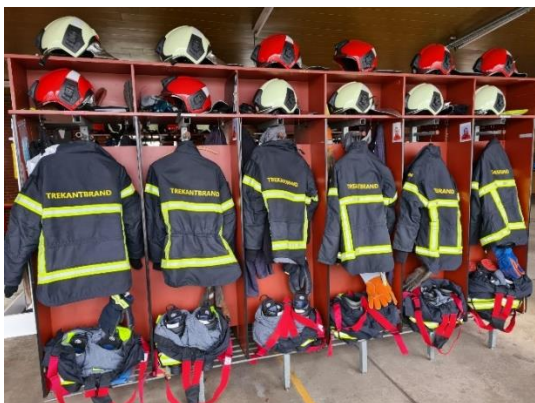
Billede af den nye ensartede indsatsudrustning

Samordningen af det logistiske område, har haft stor fokus, med henblik på at kunne høste gevinsterne af stordriftsfordele. Dette har bl.a. betyder hjemtagelse af køretøjer, materiel og indsatsudrustning i den nye Falck kontrakt. Der er foretaget en række investering i indsatsudrustning, så alle stationer nu har ens udrustning, hvad enten den drives af Falck eller TrekantBrand, dog med respekt for forskellighederne. Dette sker for at garantere kvaliteten og dermed sikkerheden af udrustningen, samt for at kunne overgå til et pulje udrustningssystem der sikre bedre samlet driftsudnyttelse.