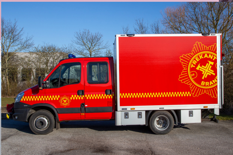
Ny redningsvogn på station Tyrstrup