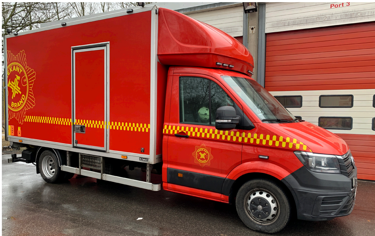
Logistikbilen i Fredericia læsses til dagens opgaver