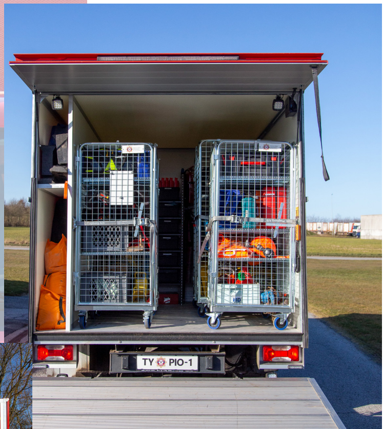
Udstyr placeret i rullebure

Historien om de to små jagthunde fanget i grævlingegraven nåede også pressen, som bragte historien i Christiansfeld Avis.