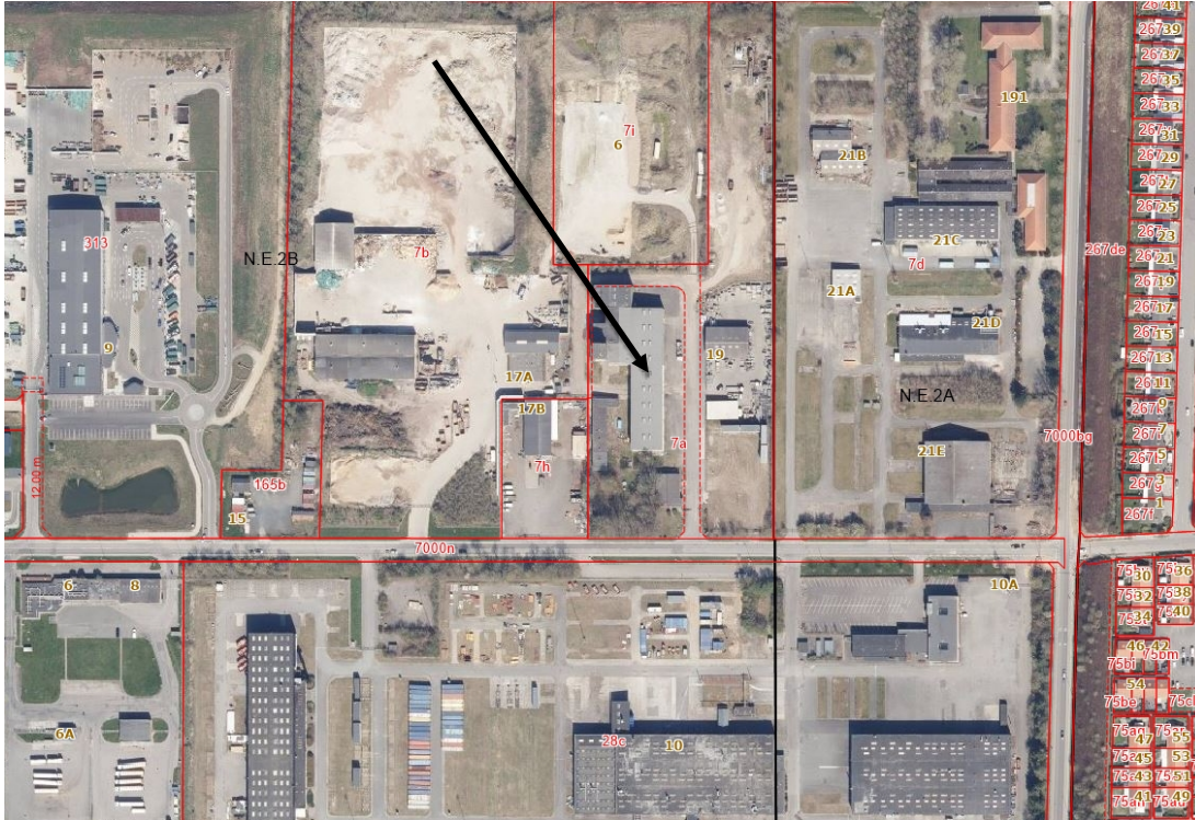
Nordre Kobbelvej 19 er markeret med en sort pil