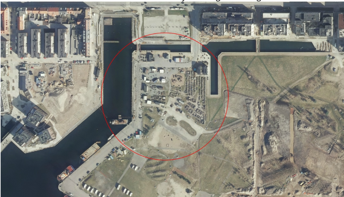
Figur 1: C-byen (rød) består primært af containere der udlejes. Der er også en iskiosk, plantekasser og et eksperiment med containerhotel

Der arbejdes på at afdække hvilke muligheder der er for midlertidige aktiviteter fremadrettet, således at der kan fastholdes liv i området indtil byudviklingen overtager arealet.