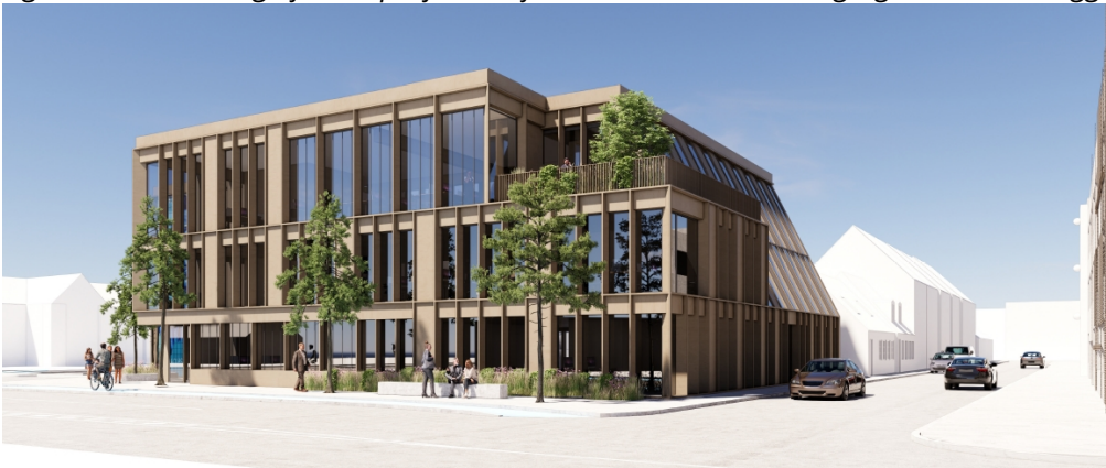
Figur 3: Visualisering af skitseprojekt set fra hjørne ved Norgesgade/Sundegade