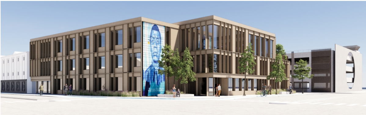
Figur 2: Visualisering af skitseprojekt set fra rundkørslen ved Norgesgade/Oldenborggade