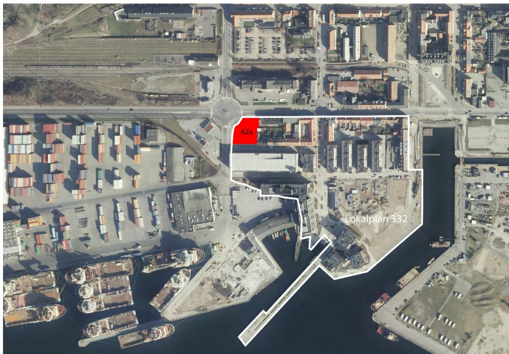
Figur 1 – Byggefelt 62a (rød) og afgrænsning af lokalplan 332 (hvid)

Grundejerne nr. 51 og nr. 770 og ønsker at få udarbejdet en lokalplan, der skal gøre det muligt at opføre hotel og blandet erhverv, herunder kontor og restaurant.