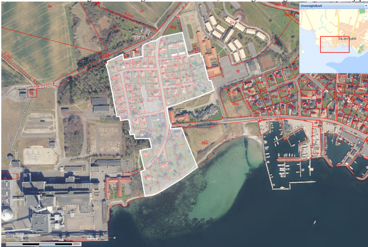
Kort der viser den forventede afgrænsning af planområdet.

Denne aftale forventes dog ikke nødvendigvis at kunne fortsætte, efter boligerne sælges til en ukendt tredjepart.