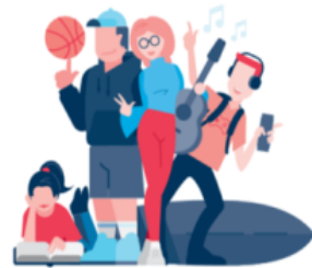
1 UDVIKLENDE FRITIDSMILJØER MED PLADS TIL ALLE