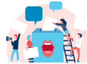
4 DANMARKS MEST DEMOKRATISKE FRITID

Frekvens har betydning for unges deltagelse Jonglere mellem flere matrikler Nye og ukendte rammer