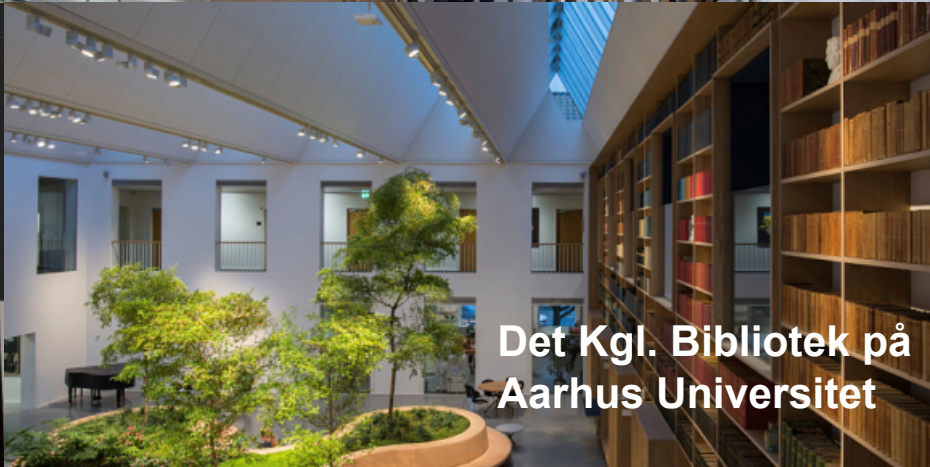
Det Kgl. Bibliotek på Aarhus Universitet