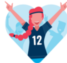
3 UFGLEMLIGE HØJDEPUNKTER I FRITIDEN