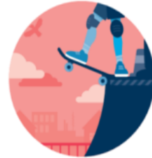
2 ØVEBANER IND I UNGE- OG VOKSENLEVENET