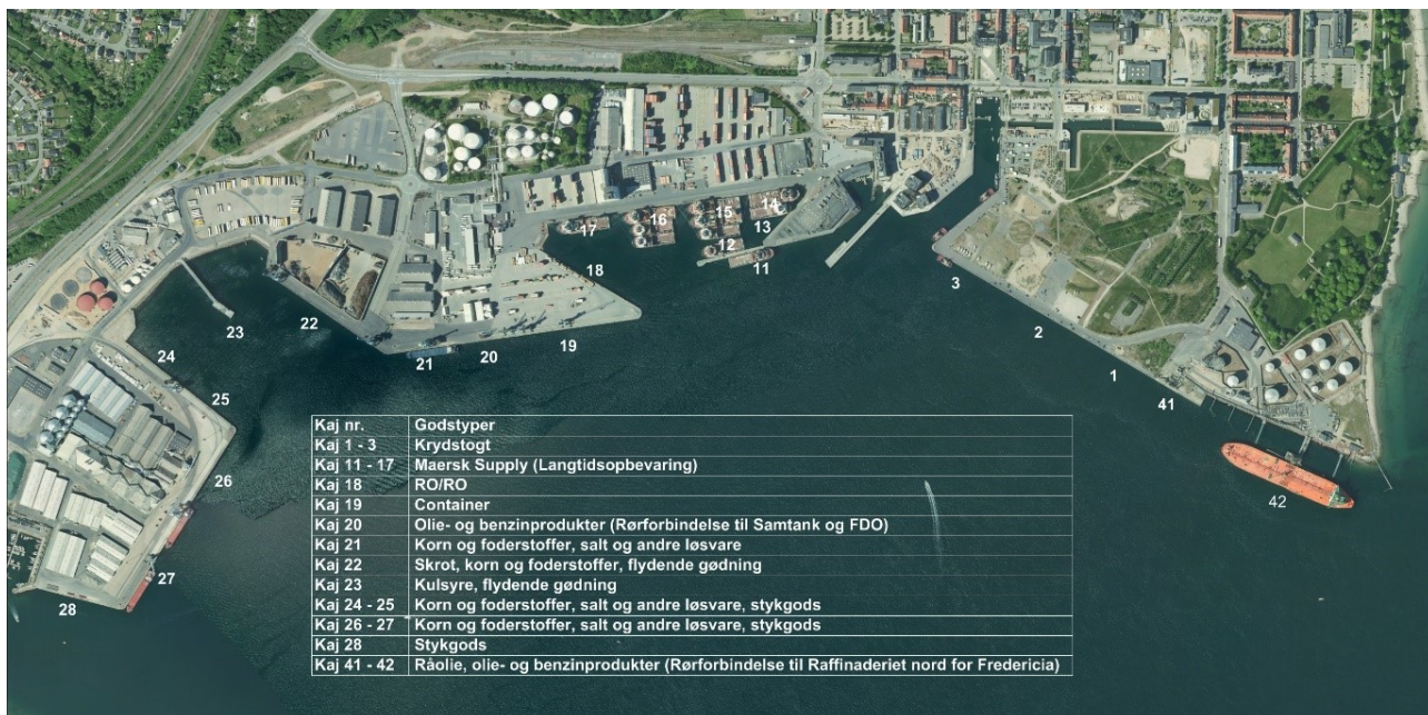
Oversigt over kajnumre og godshåndtering.